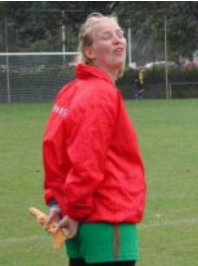
How are you? Nou...

De lekker biertjes worden verdeeld en opgedronken terwijl de dames nog in hun tenue voor de kantine 'uithijgen' van de wedstrijd (of proberen door bier te drinken wel enigszins zweet te creëren). Als de eerste dames terugkeren van de douche verspreidt het nieuws zich dat de douches koud zijn, dus wordt er besloten om tijdens de tweede helft in de kleedkamer van het eerste